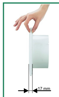
Hloubka přední mřížky jen 17mm